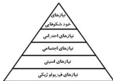
سلسله‌مراتب پنج‌پله‌ای آبراهام مزلو

یکی از نظریه‌پردازان اصلی در مکتب انسان‌گرایی، آبراهام مزلو ۲ است. از نگاه او، آدمی برای رسیدن به بالندگی شخصیتی ملزم به عبور از سلسله‌مراتبی پنج‌گانه (نیازهای فیزیولوژیکی، بدنی یا زیستی؛ نیاز به ایمنی؛ نیاز به عشق و تعلق (نیاز اجتماعی)؛ نیاز به احترام و عزت نفس؛ و نیاز به خودشکوفایی) است، زیرا در هر مرحله ابعادی از شخصیت او آشکار می‌شود و در نهایت به شکوفایی دست پیدا می‌کند. از دید پاردی، این هرم که در سال ۱۹۵۴ میلادی از جانب مزلو ارائه شده است، معمولاً برای دسته‌بندی انگیزش‌ها و نیازهای انسانی به کار برده می‌شود. در پایین‌ترین سطح هرم، نیازهای سطح پایین‌تر قرار دارند که باید پیش از پیدایی نیازهای سطح بالاتر اکتفا شوند (Pardee, 1970: 5). بدیهی است که عدم اکتفا این نیازها نتایج مخربی در زندگی شخصی و گروهی افراد برجای می‌گذارد.